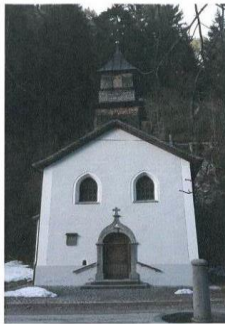
(Kapelle Maria Hilf bei Weißenbach)

Katholischer Deutscher Frauenbund Zweigverein Schwangau-Waltenhofen e.V.